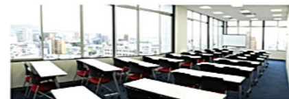
BUSINESS CONFERENCE ROOM 2 一切の無駄を省き必要なものだけを取り揃えた中会議室です。※用途に応じてレイアウトを変更できます。