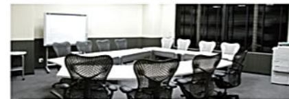
BUSINESS CONFERENCE ROOM 1 特にこだわり抜いた小会議室。理想の会議室を求めて設備ひとつひとつにこだわり、洗練された空間を作り上げました。※用途に応じてレイアウトを変更できます。

「快適な空間」で「大切な時間」をお過ごしいただけるよう、様々なスペースをご用意いたしました。久留米の中心に位置することで、各方面からのアクセスもよく、ビジネスユースからプライベートまで、幅広くお使いいただけます。