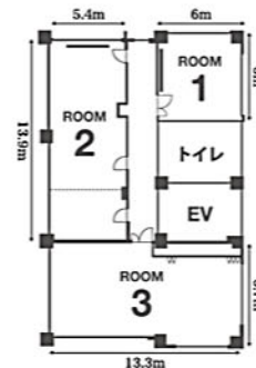
ROOM 1 収容人数 12名 広さ 36.65㎡ (約11坪)