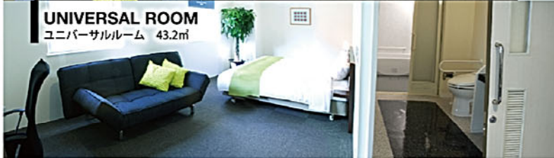
UNIVERSAL ROOM ユニバーサルルーム 43.2㎡

BED ただ眠るだけでなく、リラックスして過ごすためにシングルルーム全室にクィーンサイズベッドを御用意。