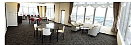
BUSINESS CONFERENCE ROOM 3 展示会、パーティー会場、各種お祝事、お花教室、習い事等あなたのお好きな時間だけご利用下さい。※用途に応じてレイアウトを変更できます。