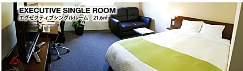
EXECUTIVE SINGLE ROOM エグゼクティブシングルルーム 21.6㎡