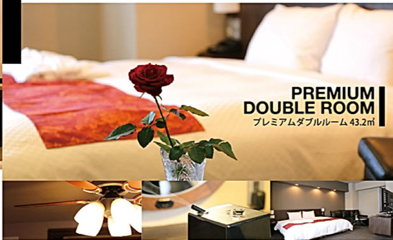
PREMIUM DOUBLE ROOM プレミアムダブルルーム 43.2㎡