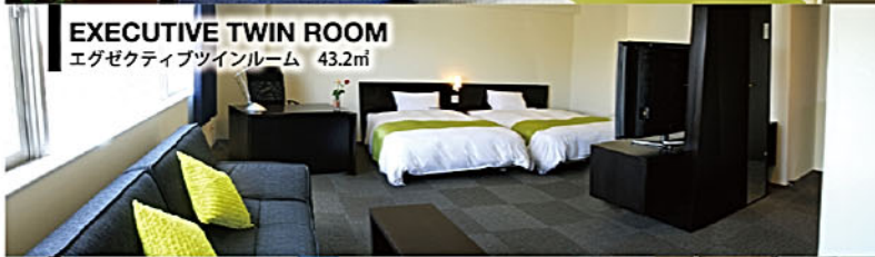
EXECUTIVE TWIN ROOM エグゼクティブツインルーム 43.2㎡